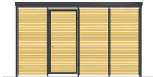
Holz zwischen den Stützen