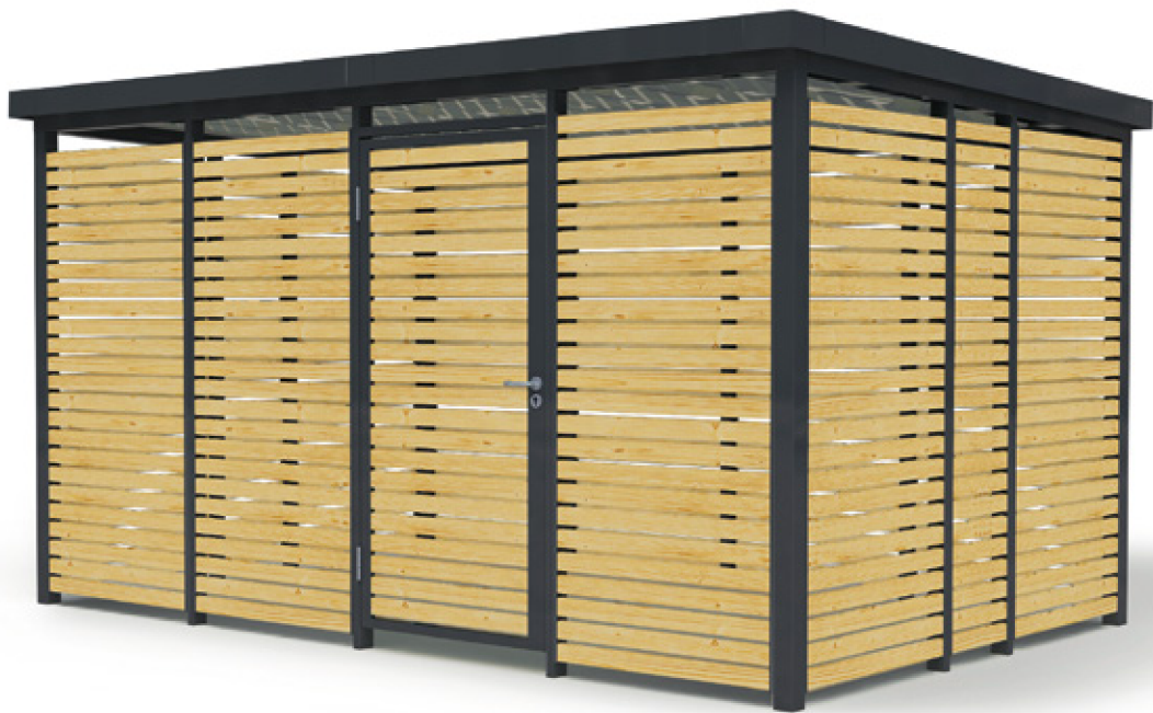
Holz zwischen den Stützen